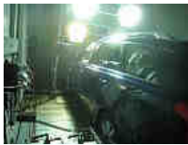
Bild 3: Ein Fahrzeug wird im Klimaprüfstand der Empa bei hoher Temperatur, Feuchte und Sonneneinstrahlung getestet.

Bei Dieselfahrzeugen ist der klimaanlagenbedingte Mehrverbrauch – vor allem innerorts – etwas geringer (total 2.7 Prozent); für innerorts, ausserorts und Autobahn ergeben sich Werte von 4.5 beziehungsweise 2.3 und 1.2 Prozent. Das Einsparpotential beim Abschalten der Klimaanlage unter 18 Grad Aussentemperatur liegt aber auch hier bei zwei Dritteln.